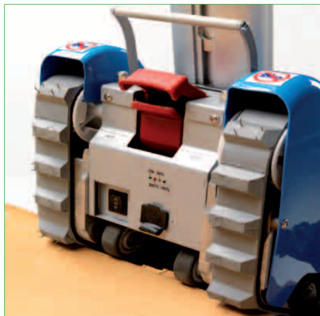
Podwójna blokada, elektryczna i mechaniczna, zaczepek kolumny sterującej do korpusu silnika