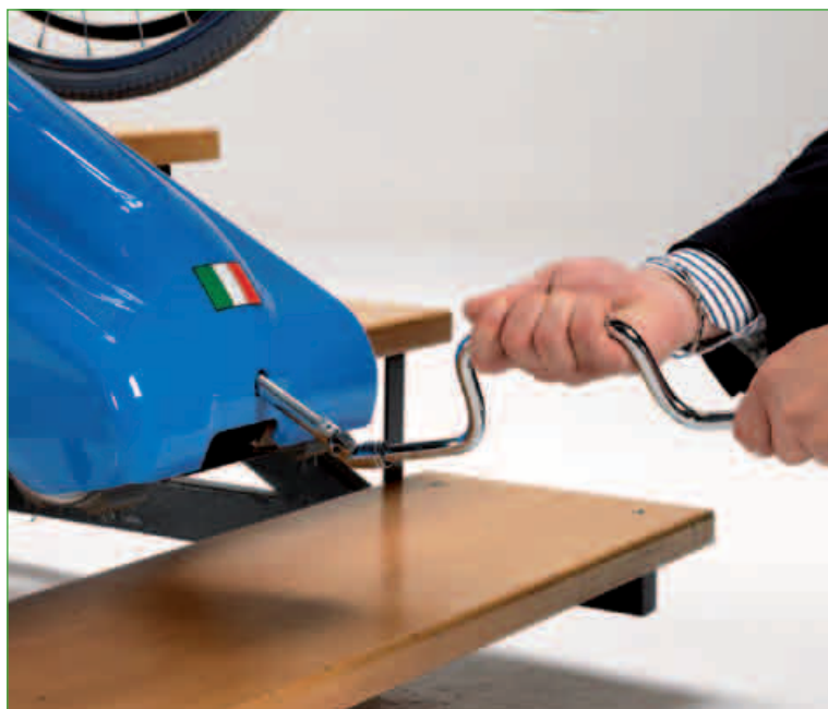
Urządzenie do ręcznego sterowania