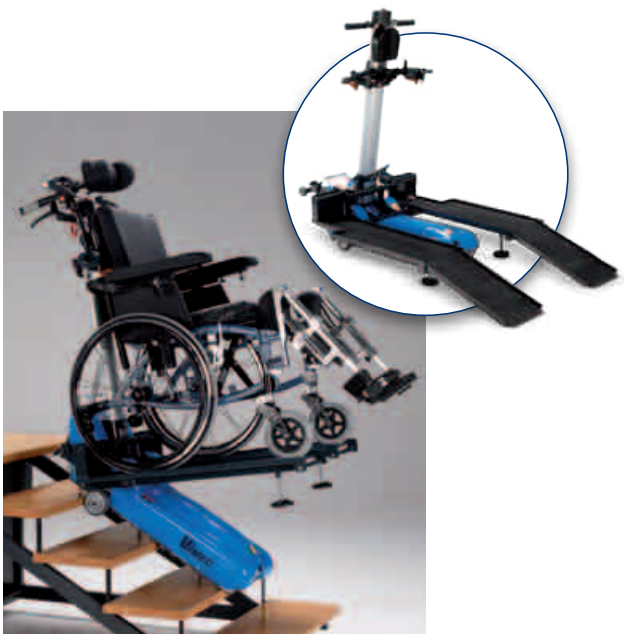
Wersja z podestem wielofunkcyjnym (P.P.)