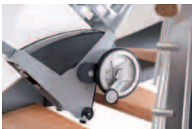
Mechanizm stopu na stopniu