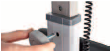
Regulacja wysokości kolumny sterującej

- Zgodność z Europejską Dyrektywą Kompatybilności Elektromagnetycznej 2004/108 EWG