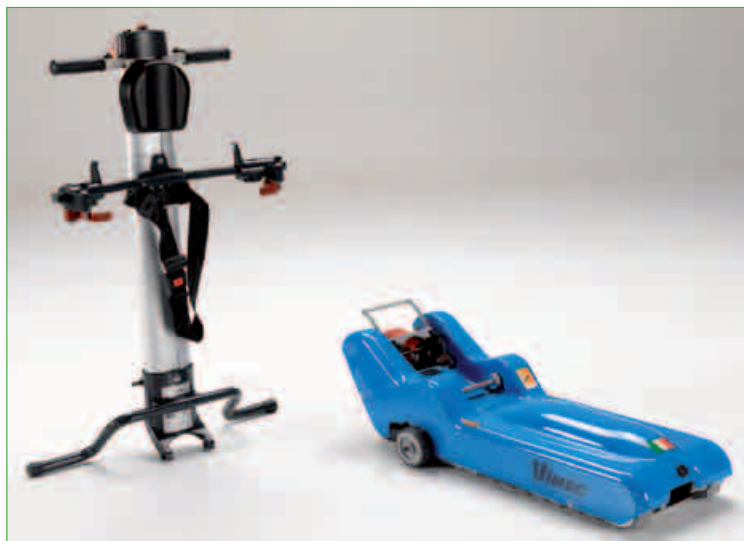
Kolumna sterowania self standing i korpus silnika

T09 Roby Schodolaz gąsienicowy - szczytowe osiągnięcie pod względem komfortu i bezpieczeństwa. Roby umożliwia osobom na wózku inwalidzkim pokonywanie barier architektonicznych, utrudniających poruszanie się zarówno wewnątrz jak i na zewnątrz budynku. Został opracowany i zrealizowany z myślą o pokonywaniu schodów prostych oraz z kwadratowymi/prostokątnymi spocznikami w sposób całkowicie bezpieczny i bez ryzyka zniszczenia schodów , dzięki specjalnie zaprojektowanym gąsienicom, które zapewniają optymalną przyczepność i nie zostawiają śladów. Roby to z pewnością produkt kluczowy dla wszystkich sklepów ze sprzętem ortopedycznym i rehabilitacyjnym, pragnących oferować swym klientom najnowocześniejsze rozwiązania.