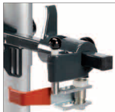
Mocowania ustawiane i regulowane w pionie oraz w poziomie